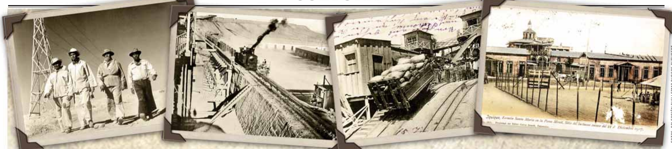
Obremos llegan al turno de trabajo en la Oficina Pedro de Valdivia.