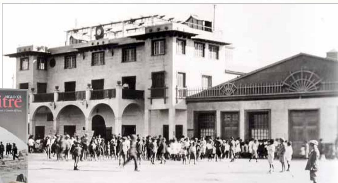
Vista del teatro y la filarmónica en Chacabuco. Función infantil de domingo.

"Desde Europa llegaba una cantidad impresionante de veleros a estos puertos y se queda-